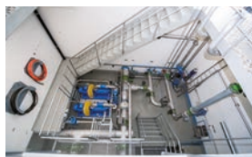
Reservoir Bachtalen (ausser und innen)