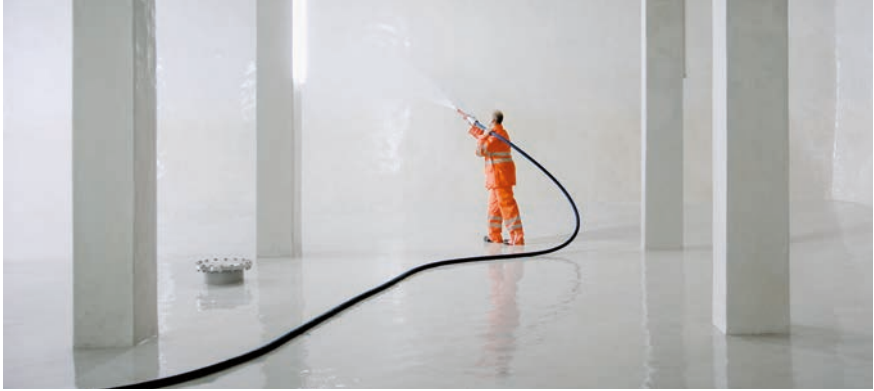
Reinigung des Reservoirs

Im Betriebsjahr 2019 hatten wir total sieben Schadstellen im Leitungsnetz, wovon eine Hauptleitung, vier Hauszuleitungen, ein defektes Steuerkabel (verursacht bei Grabarbeiten) und einen umgefahrenen Hydranten. Durch die automatische Alarmierung unseres Leitsystems verzeichneten wir 7 Störungen. Alles konnte innert nützlicher Frist behoben resp. repariert werden.