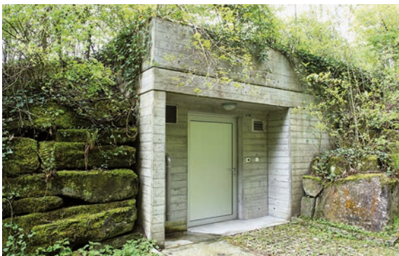
Reservoir Schlossberg (aussen und innen)