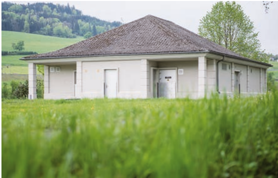
PW Reusschachen (aussen und innen)