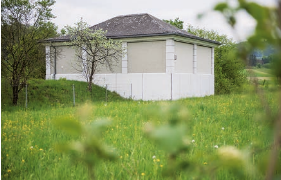
Reservoir Berchtwil (aussen und innen)