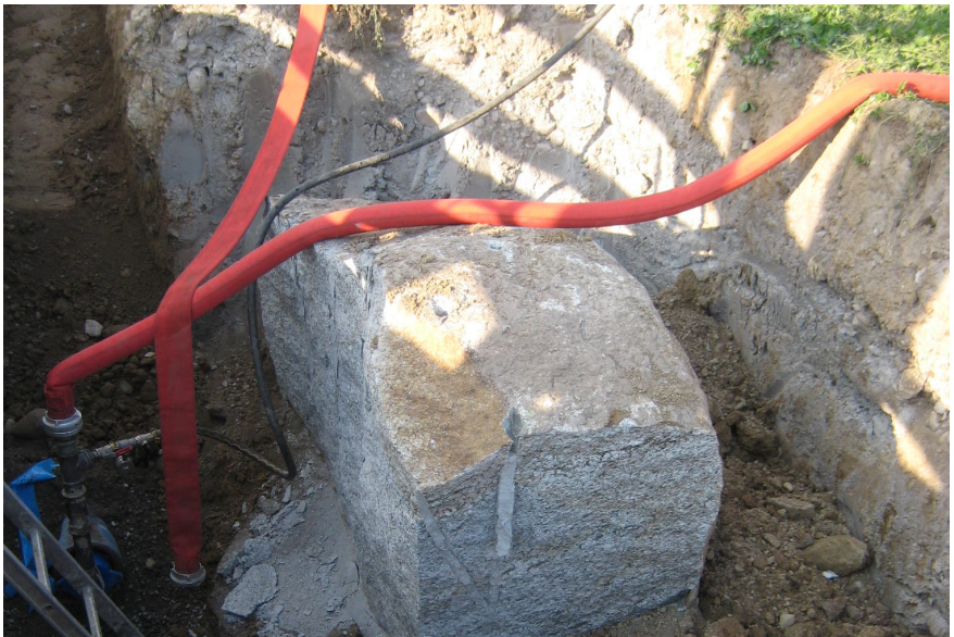
Sanierung Leitung Dersbach Grössere und kleinere Hindernisse, Findling aus Gneis, ca. 40 t