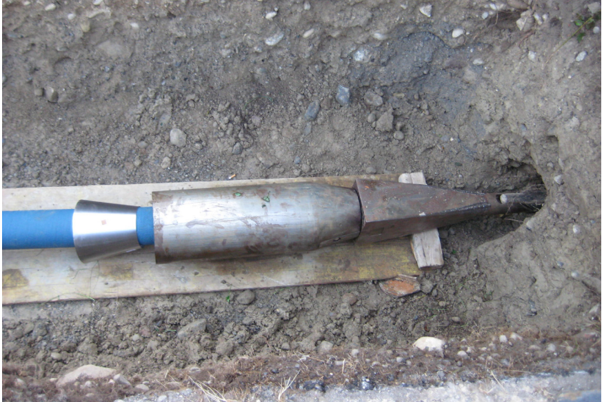
Sanierung und Erneuerung Leitung Dersbach Schneidkopf beim Rohreinzug mit dem Berstverfahren