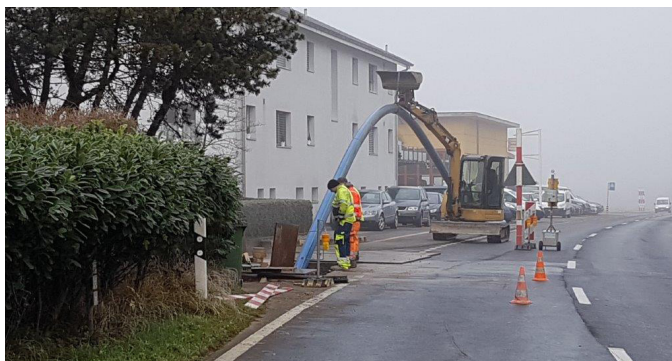
Hauptleitung Holzhäusern – Buonas Rohreinzug, grabenloser Leitungsbau im Press-/Zieh-Verfahren