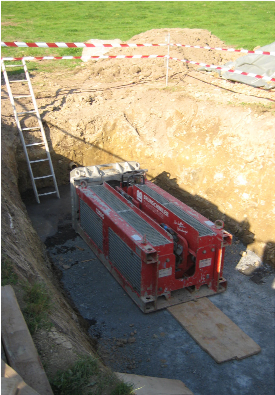
Sanierung Leitung Dersbach Hydraulische Zugmaschine 40 t für den Rohreinzug im Berstverfahren