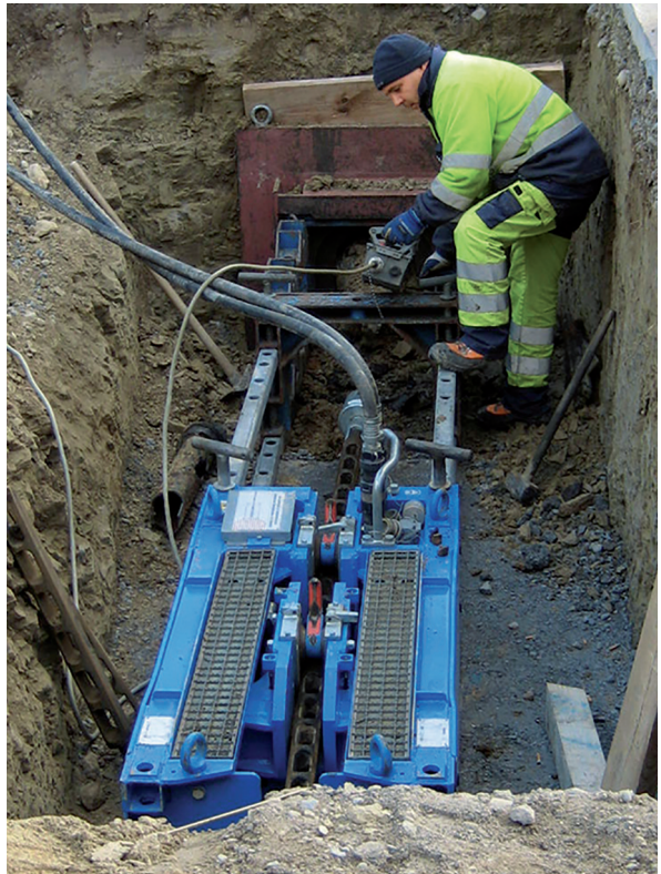
Maschinengrube in grabenlosem Bauverfahren