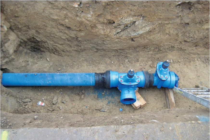
Leitung Dersbach Leitungsabgang und Streckenschieber